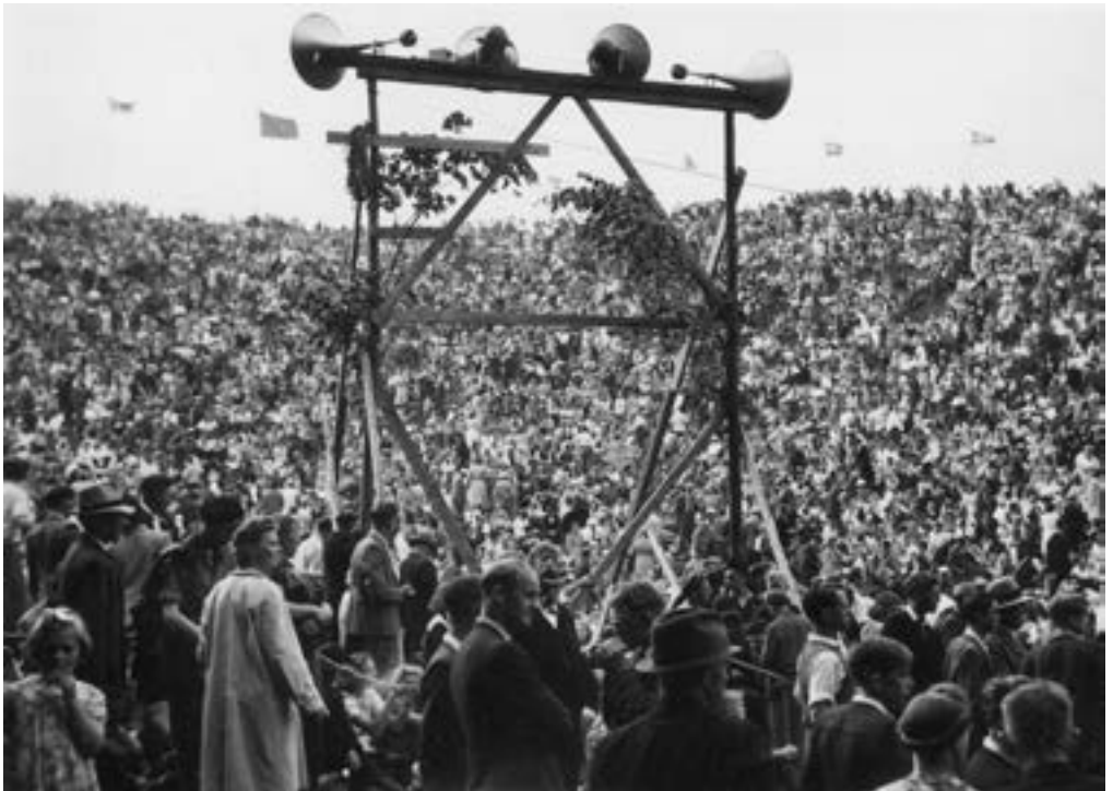
Befrielsesfest på Skamling den 24. juni 1945

Klokkestablen er tegnet af arkitekterne Poul Hauge og Ole Kørnerup Bang. De lod sig inspirere af de klokkestabler, der står ved mange sønderjyske kirker, til en klokkestabel i beton, der blev indviet den 2. maj 1948.