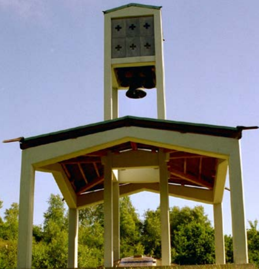
Klokkestablen på Skamling